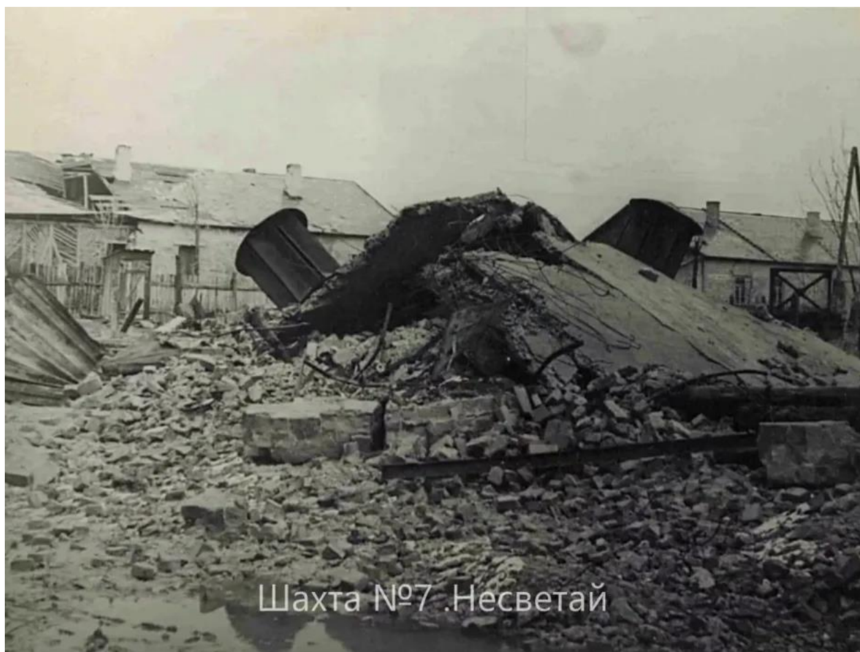
1943 год. Разрушена шахта № 7.