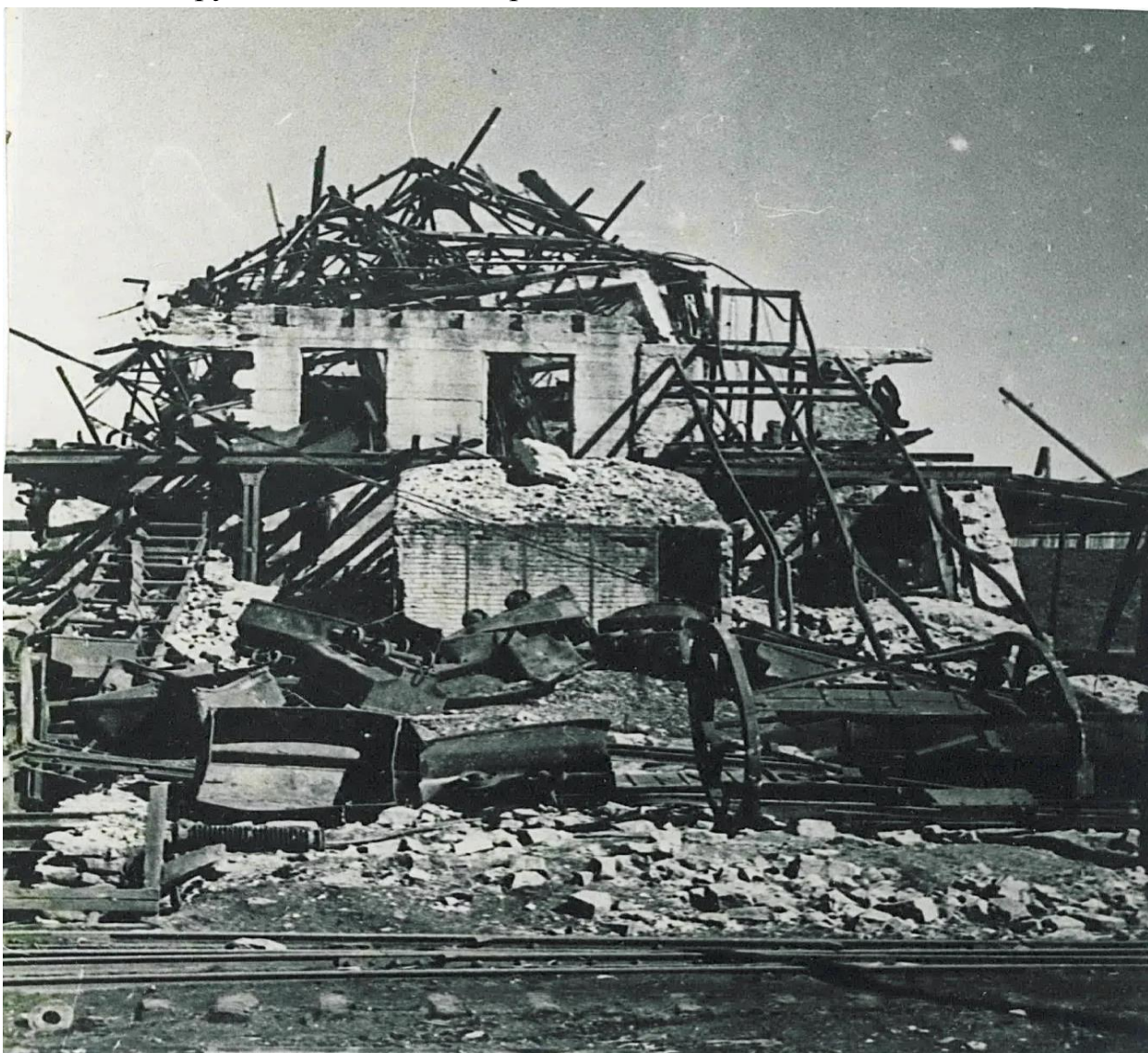
1943 год. Разрушена ЦОФ им. Молотова.