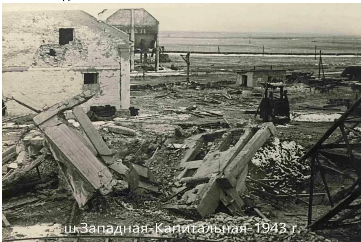
1943 год. Разрушена шахта «Западная - Капитальная».