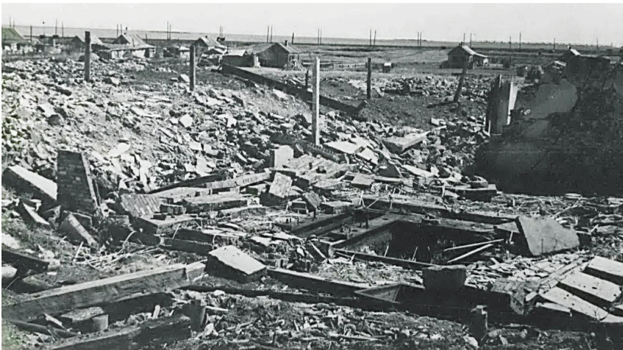
1943 год. Разрушена шахта им. Кирова.