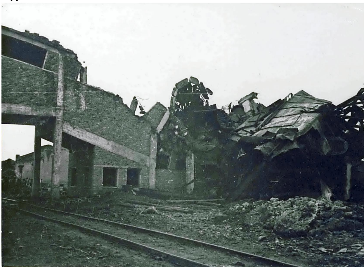
1943 год. Разрушена шахта № 5.