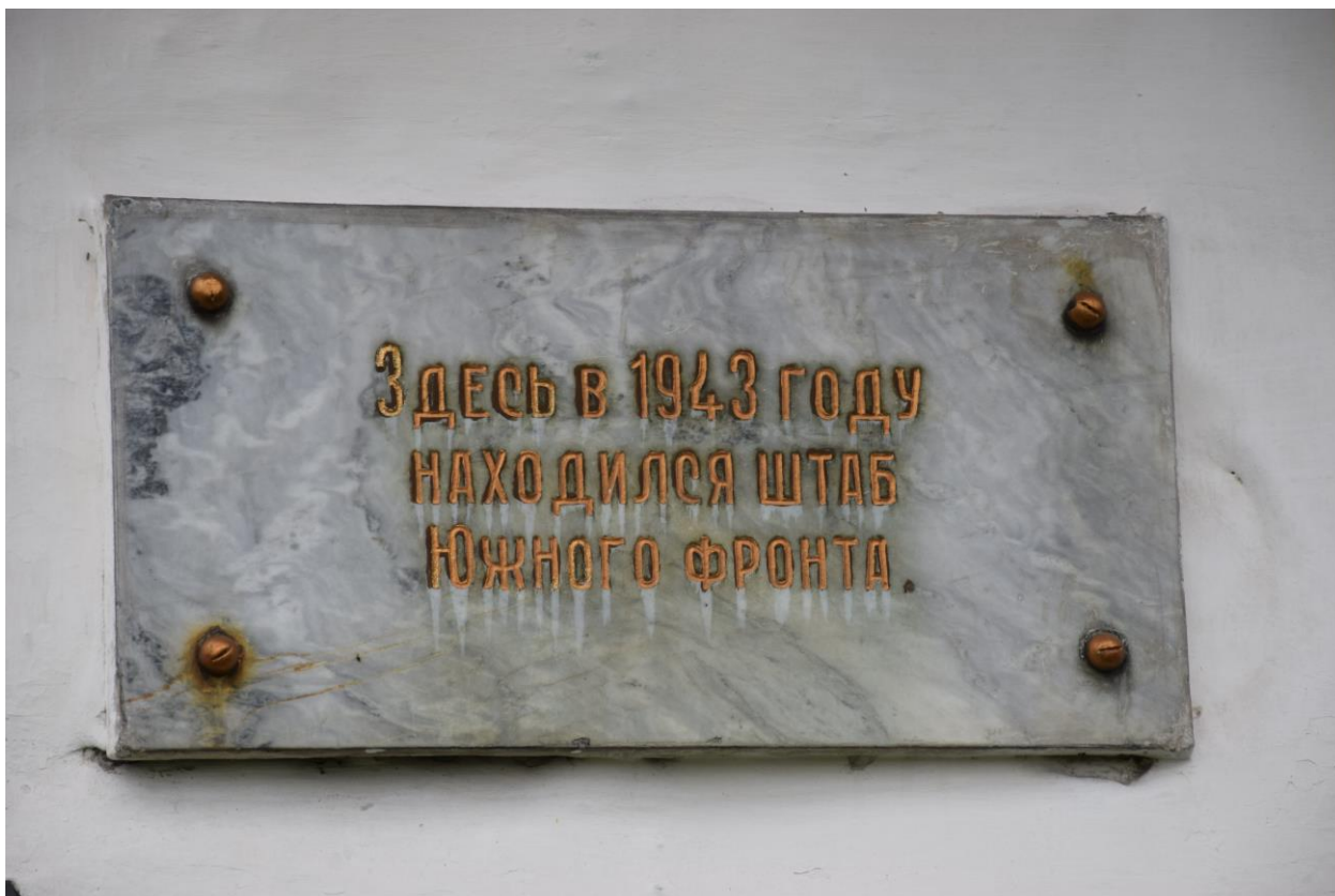
Мемориальная доска на фасаде одноэтажного строения № 17 по улице Фрунзе.